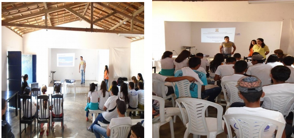
Figura 4: Registro das Palestras aos alunos do Fundamental II