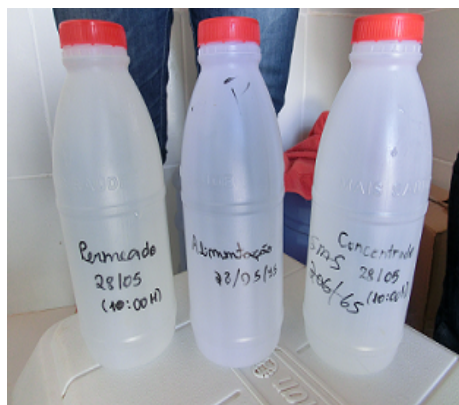
Figura 1: Registro das coletas de amostras de águas