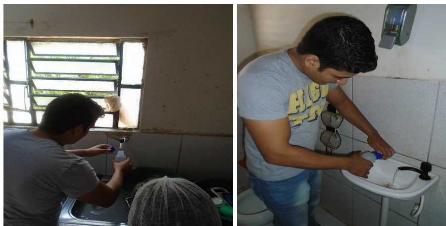
Figura 2 – Coletas de Pontos da Escola